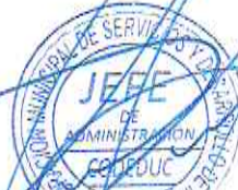
Oswaldo Soto S.